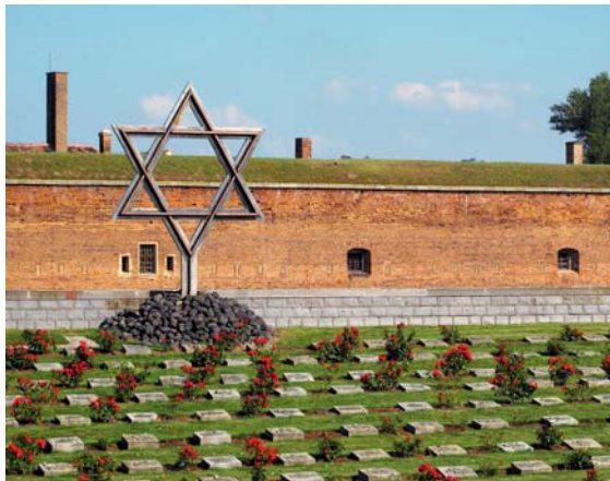
Lety u Písku (vlevo) a Terezín (vpravo) – neznámější místa paměti holokaustu na území České republiky